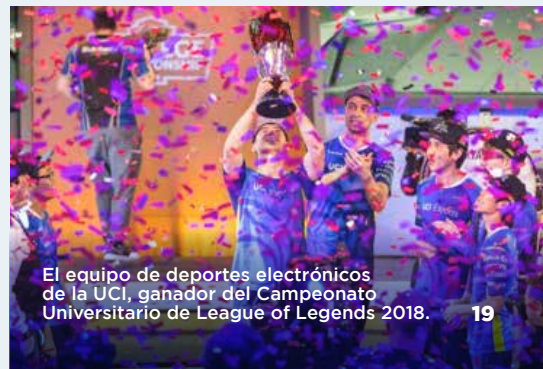
El equipo de deportes electrónicos de la UCI, ganador del Campeonato Universitario de League of Legends 2018.