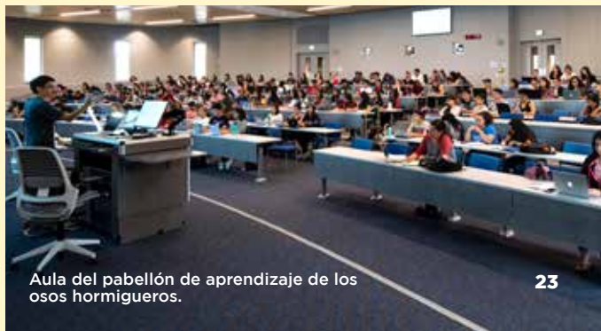
Aula del pabellón de aprendizaje de los osos hormigueros.